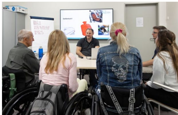
Corsi di formazione di gruppo su vari argomenti, dai pari alle persone colpite.

Il «Peer Counselling» si riferisce a una forma speciale di consulenza in cui le persone coinvolte sono consigliate da persone nella loro stessa condizione. Si basa sul presupposto che le persone che si trovano in una particolare situazione possano accettare con maggiore credibilità l'aiuto fornito da chi ha vissuto un'esperienza analoga. Questa consulenza, orientata alla vita di tutti i giorni, dà alle persone in riabilitazione speranza, coraggio e fiducia per la vita presente e futura.